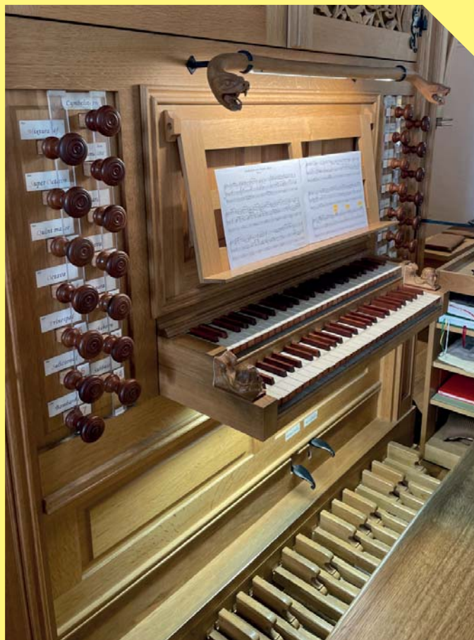
Lukáš si zahrál také na jedny z největších varhan na světě.